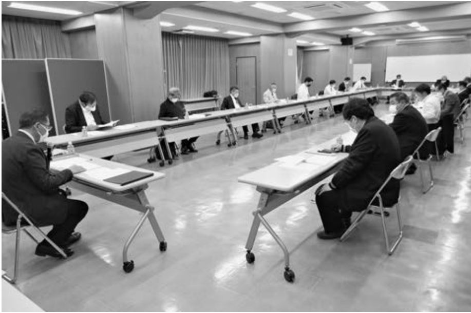
総会の前には、6月度理事会が開催された